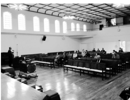
疲れたらお茶とお菓子で休憩

また、今年度の常例布教線は実施対象会所と日程を調整しその日程で派遣可能な開教使を募り、特に教団との関わりが希薄となつている地域とのつながりを再度強く持てるよう実施する予定だ。 議題3 2019年度予算 本部より予算案が提示されたが年々増え続ける支出に対して予算の確保が厳しくなっている現状のため改善が急務である。 議題4 教団規約各規定 総会配布資料として各代議員